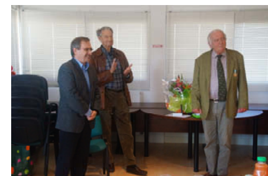
Aménagement floral à St James